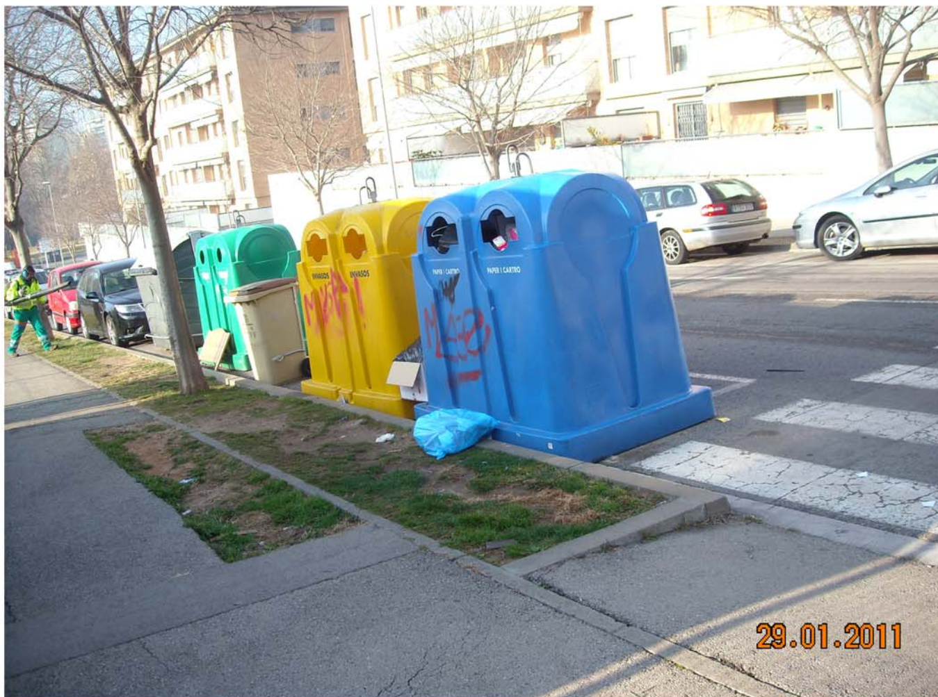
-Nova ubicació dels contenidors del c/ Pont de Can Vernet amb el c/ Carrasco i Formiguera, per millorar la visibilitat dels conductors.