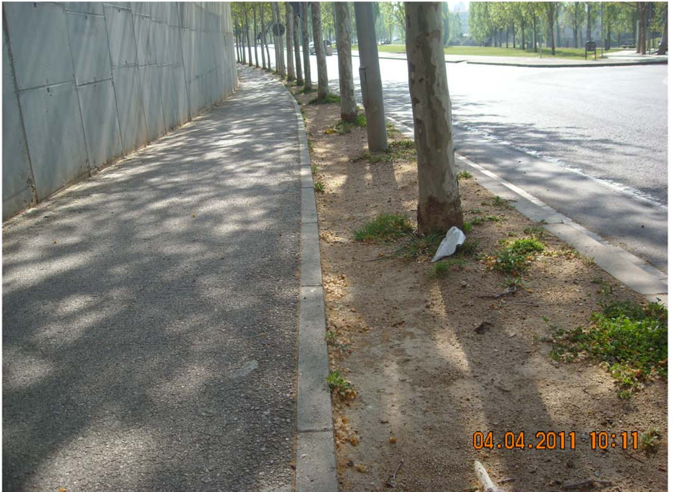
-Asfaltat o enrajolat de les voreres on hi havia gespa al perímetre del centre Esportiu Jaume Tubau.