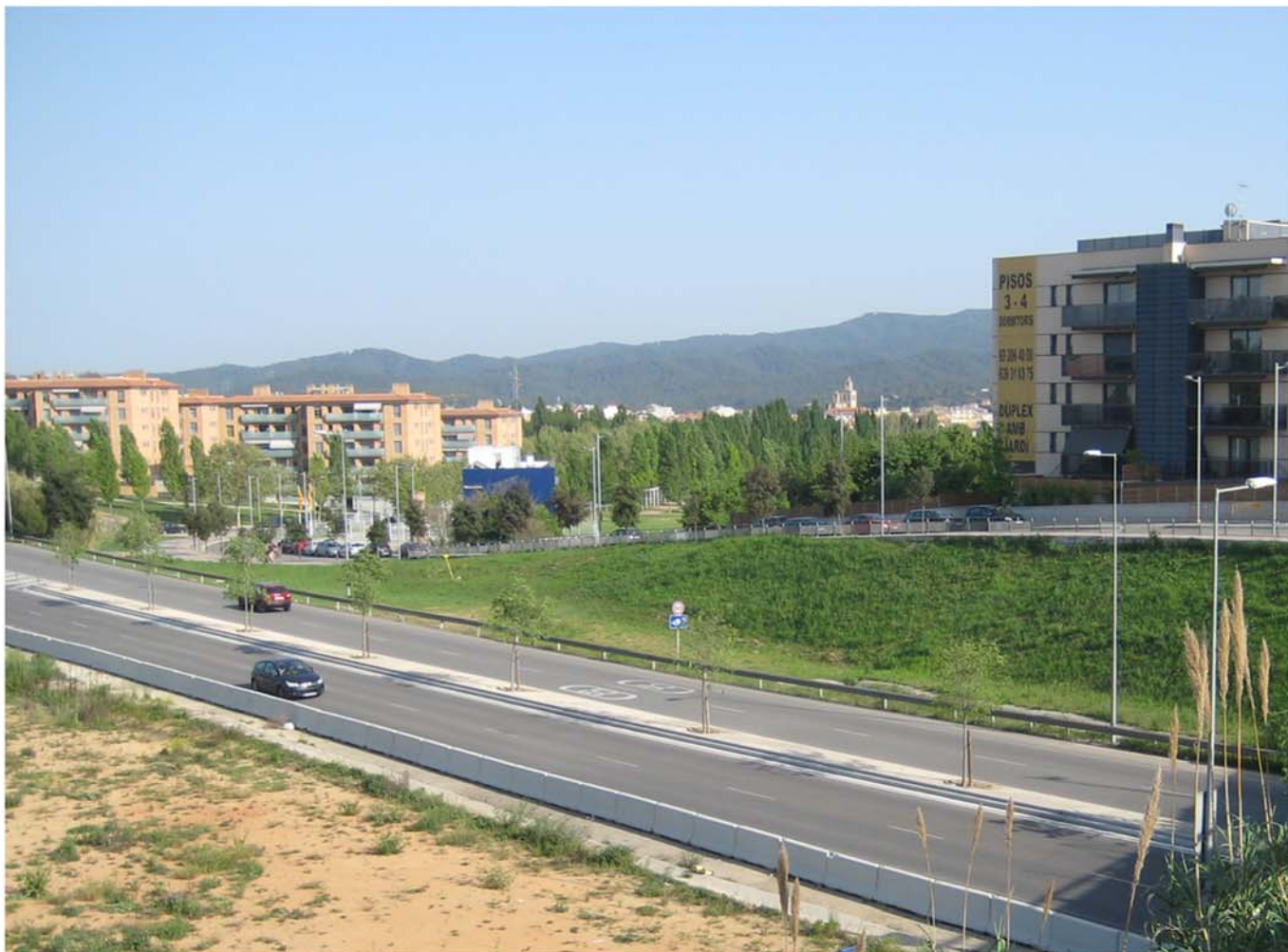
-Pintat de la mitjanera de la Ronda Nord.