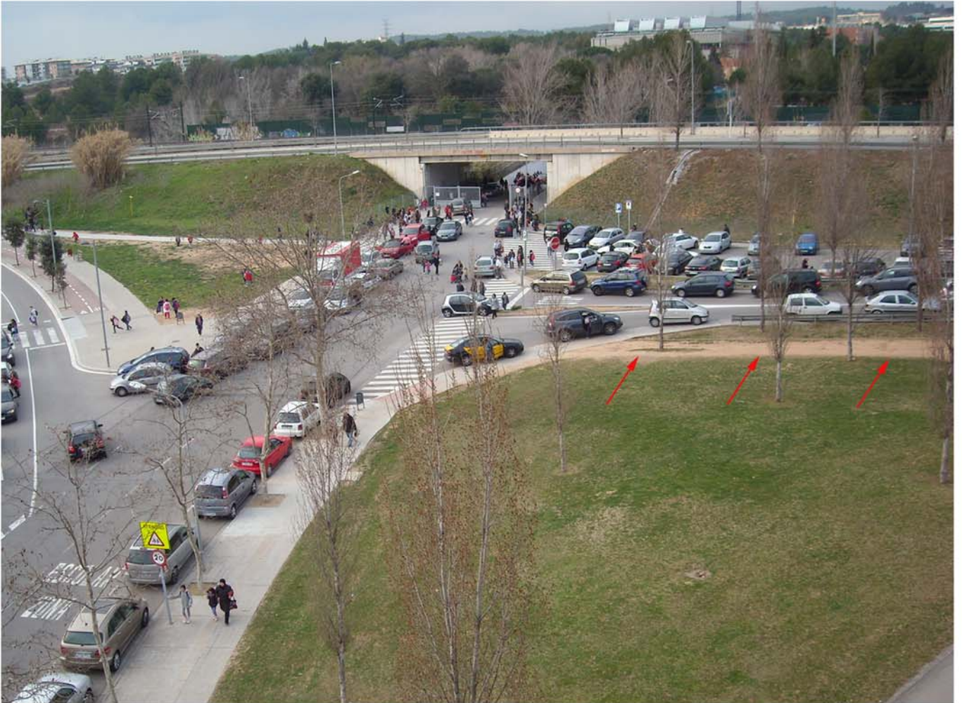
-Asfaltat del Camí paral.lel al pàrquing de l'escola Els Pins i arrenjament del asfaltat actual.