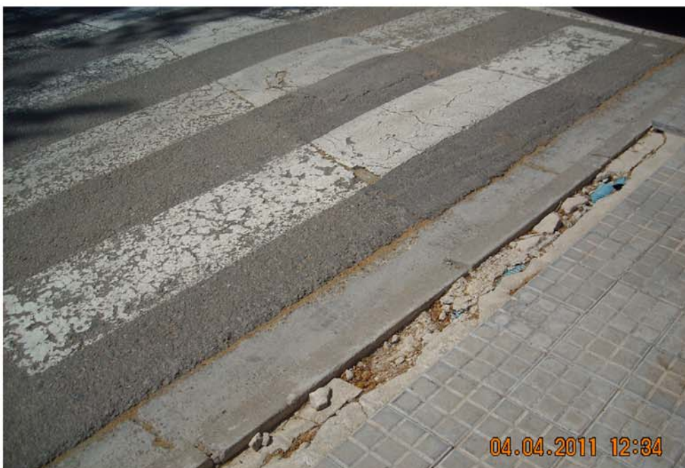
c/Volpelleres 22, rampa de peatons i reparació.