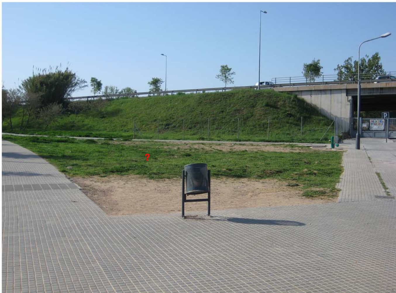
-Triangle Escola Els Pins. Plantat d'arbres o instal·lació de gronxadors. Sanejament voreres Avda. can Volpelleres.