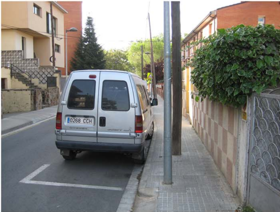
c/de la Mina pòsters de telèfon.