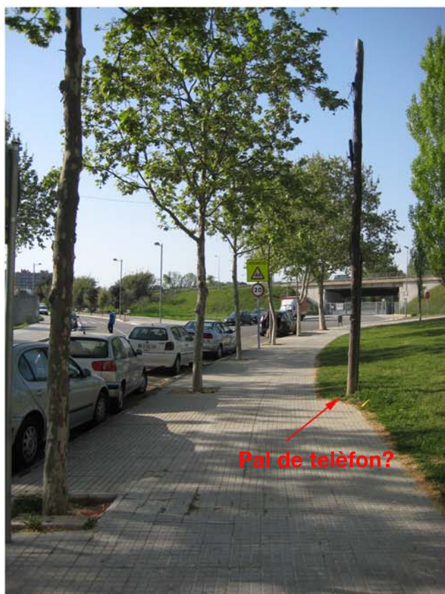
Pai de telèfon?