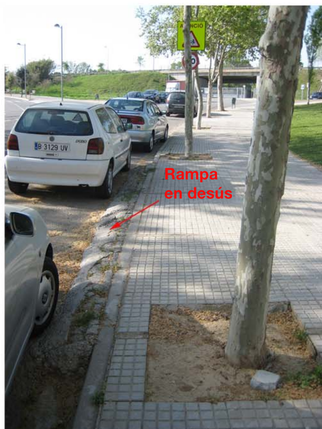
Rampa en desús