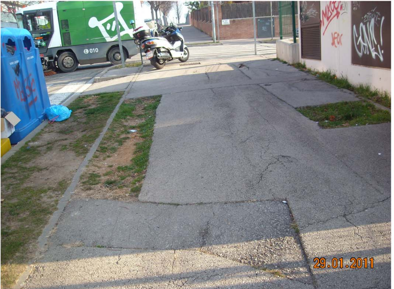
-Arranjament de les voreres del C/Pont de Can Vernet amb c/Carrasco i Formiguera i Avda. Can Volpelleres.