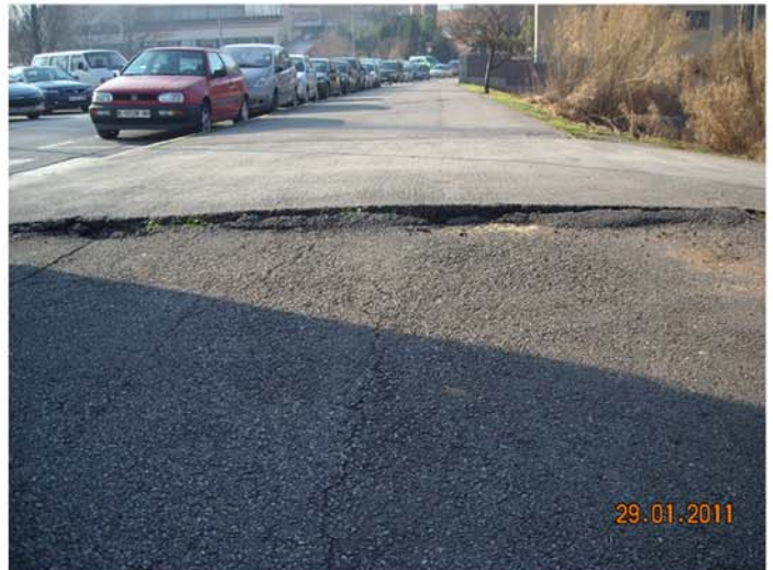
c/Sant Juli, rampes pas de peatons i reparació de la vorera.